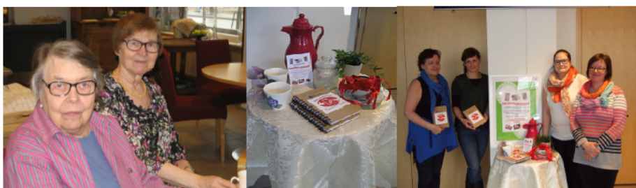
Kuvat: Vierailukampanjaan osallistuneita asukkaita MEREOn Matinkylän palvelutalosta, valmis kahvipöytä ja kehittäjät.