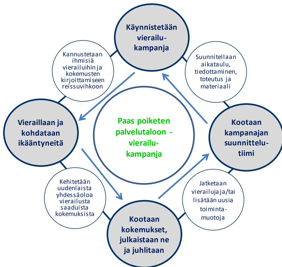
Kuvio 2. Vierailukampanjan toteutus.

Vierailukampanjassa voidaan käyttää seuraavia ja liitteenä olevia mallin kehittämistyössä laadittuja esimerkkimateriaaleja: