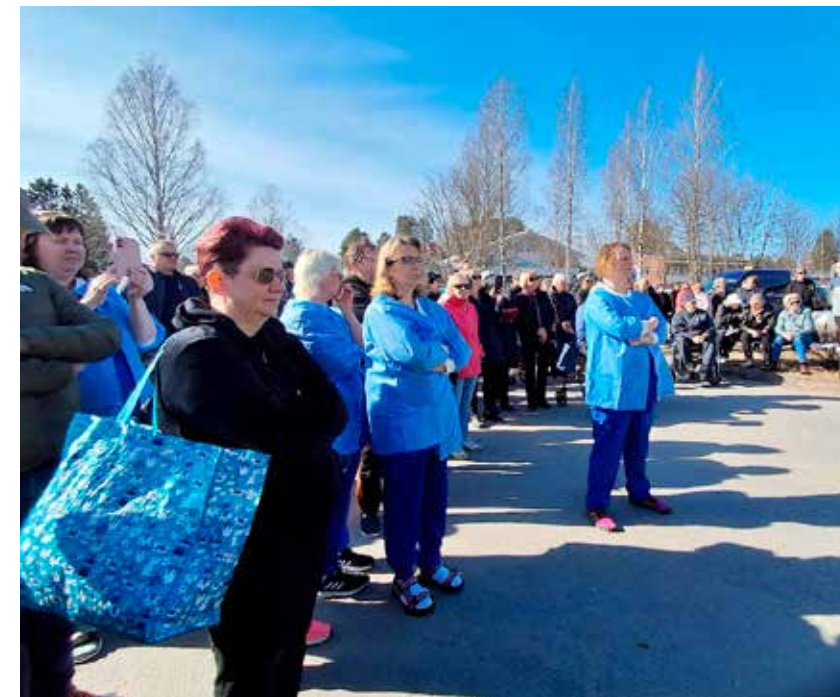
Hoitajat olivat kovin vaikeita, kun työt loppuivat isolta joukolta. Viimeinen sammuttaa huomena valot.