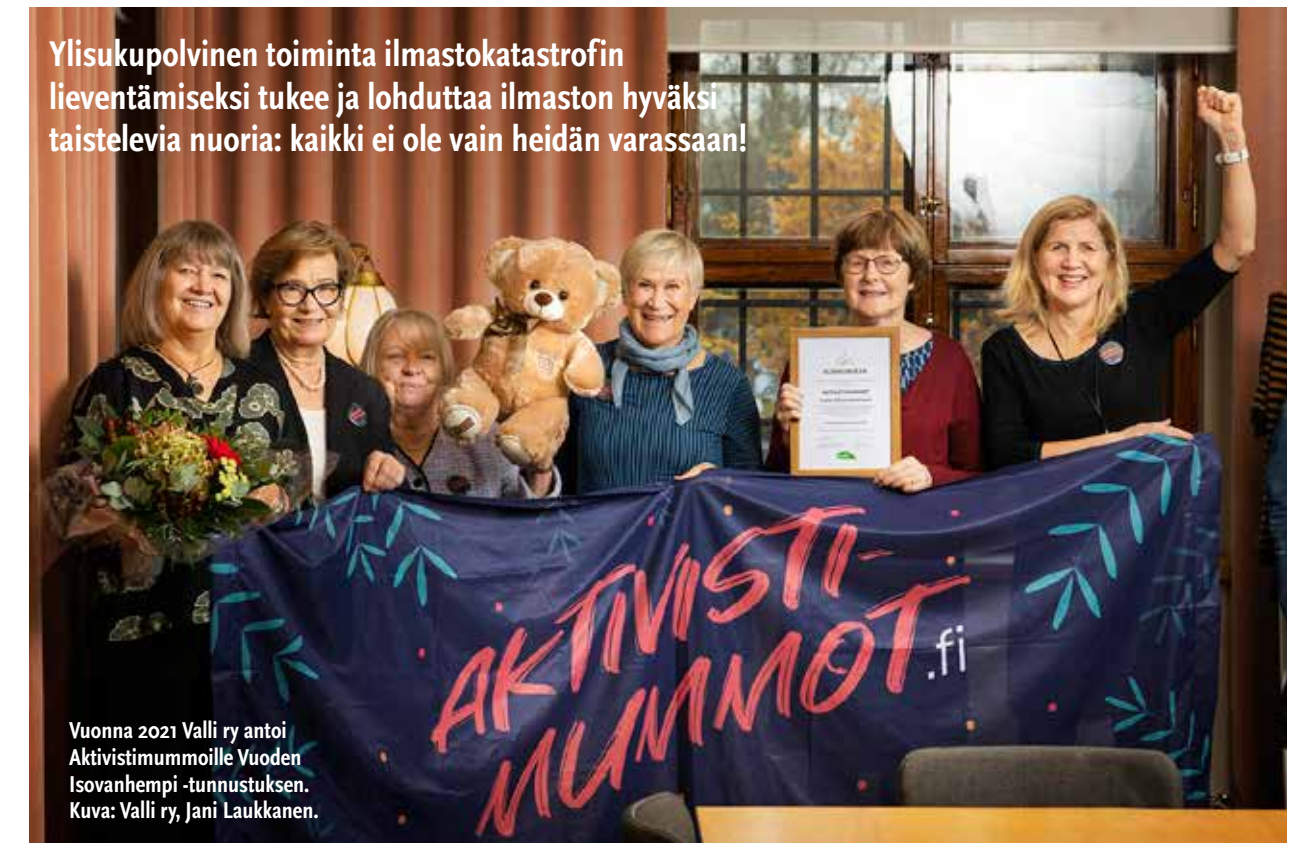
Vuonna 2021 Valli ry antoi Aktivistimummoille Vuoden Isovanhempitunnustuksen.

Maaliskuun lopussa Svenska Yle esitti dokumentin Klimatommona (41 min), joka esitteli Aktivistimummojen ja Ilmastoisovanhempien työtä vuoden ajalta. bit.ly/klimatommona