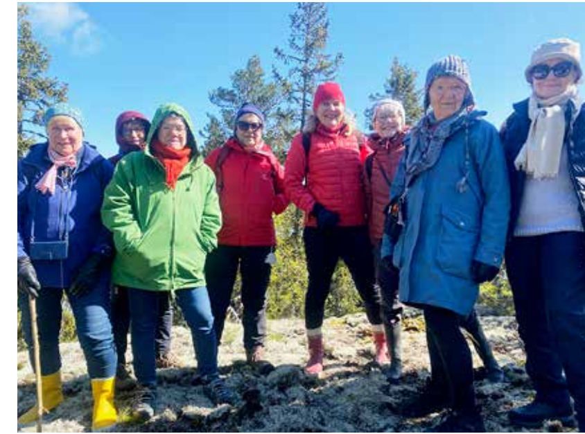
Joukko Aktivistimummoja retkellä Korppoossa sijaitsevalla Inikorpin ikimetsäalueella, joka hankittiin 2024 Aktivistimummojen viisi vuotta kestäneen Luonnonperintösäätiön Mummometsä-keräyksen tuloksena.

Ikimetsillä on tärkeä rooli luonnon monimuotoisuuden vaalimisessa. Toimintansa alusta alkaen ryhmä on kerännyt varoja Luonnonperintösäätiön suojeltavaan Mummometsään. Keväällä 2024 keräyksen ensimmäinen vaihe toteutui, kun keräämämme yli 30 000 euron lahjoitus toi tärkeän panoksen Inikorpin ikimetsän (Korppoossa) suojelemiseen. Nyt Aktivistimummotilla on uusi Mummometsä-keräys menossa. Turhan tavaran sijaan moni haluaa antaa lahjaksi varoja Luonnonperintösäätiön