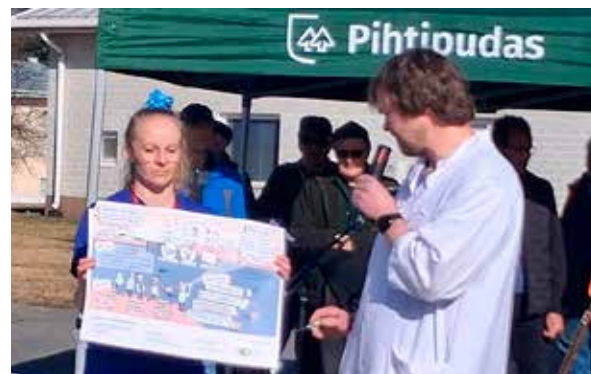
Pihtiputaan lääkäri kävi hoitajan kanssa läpi Keski-Suomen hyvinvointialueen visiota todeten ettei useat kohdat toteutuneet Pihtiputaan kohdalla.