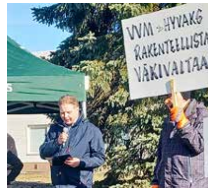
Kunnanjohtaja kertoi kunnantalolla olevan suruliputus vaikuttamistyön epäonnistuttua. Ei auttanut, vaikka oli annettu lausuntoja ja valittu sulkemispäätöksestä. Pihtiputaan osuus hyvinvointialueen säästöistä on moninkertainen.

Teksti ja kuvat: Helena Pihlajasaari, kunnallisneuvos