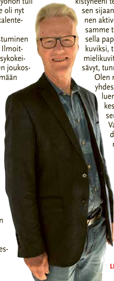
LEDARARTIKEL PÅ SVENSKA, SIDAN 39.

Olen mukana lukupiirissä. Sovimme yhdessä, minkä kirjan seuraavaksi luemme ja seuraavalla kerralla keskustemme siitä. Lukukokemuksemme ovat usein hyvin erilaisia. Vaikka teksti on sama, ovat meidän aivomme ja mielikuvituksemme yksilöllisiä. Hyvä kirja on kenties sellainen, joka ruokkii anteliaasti mielikuvitustamme, vie ajatuksemme uusiin ja yllätyksellisiin maailmoihin. Hyvä kirja, elokuva, teatteri-, musiikkitaikatahansa taide-esitys ravitsee ja virkistää silloin, kun se avaa ajattelulle uusia ovia, ja mielikuvitukselle uusia maailmoja.