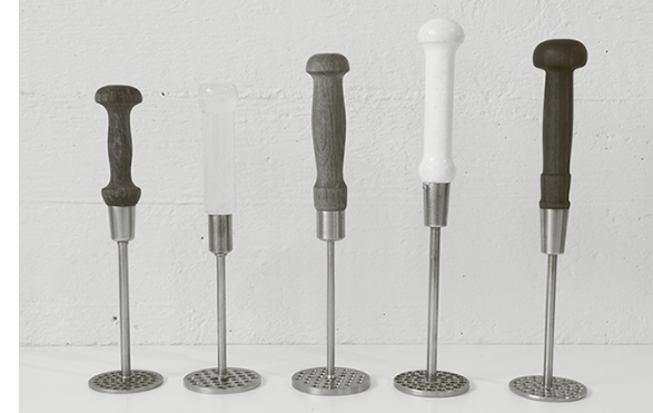
Työnumero 105 -näyttelyssä Kuusankosken Taideruukissa 2015 kesällä oli esillä Kymi-yhtiöiden paperitehtailla tehtyjä firabelityöitä.