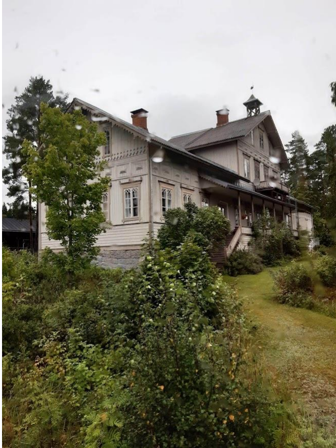
Tunkelon kartano suuruusluokkaa, keskikohdalle mahtuu normi talo