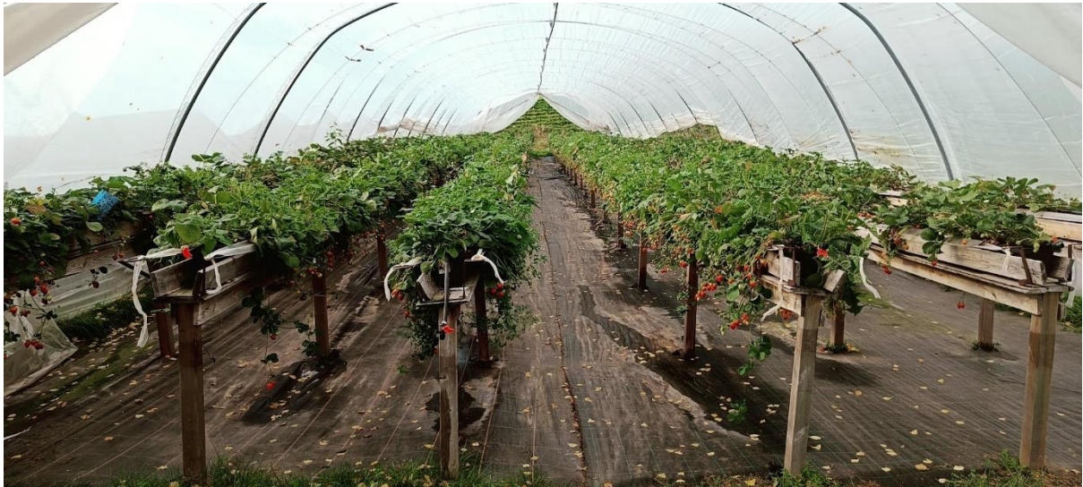
Uusi-Riihjärventilan tunnelimansikkaa syksyllä.