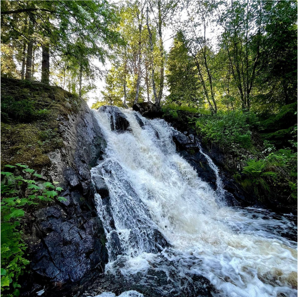
Partalan Juveninkoskesta pieni otos