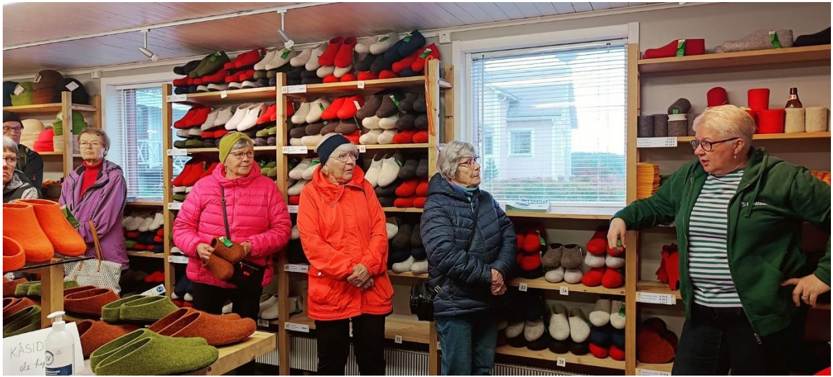
Huopatehdas Lahtinen. Historiaa