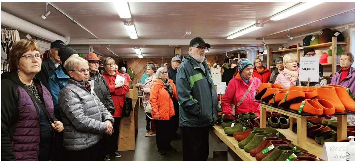
Lahtisen huopatehdas esittelyä.