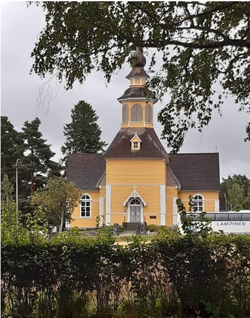
Längelmäen kirkko, jäi jaon jälkeen Oriveden puolelle.