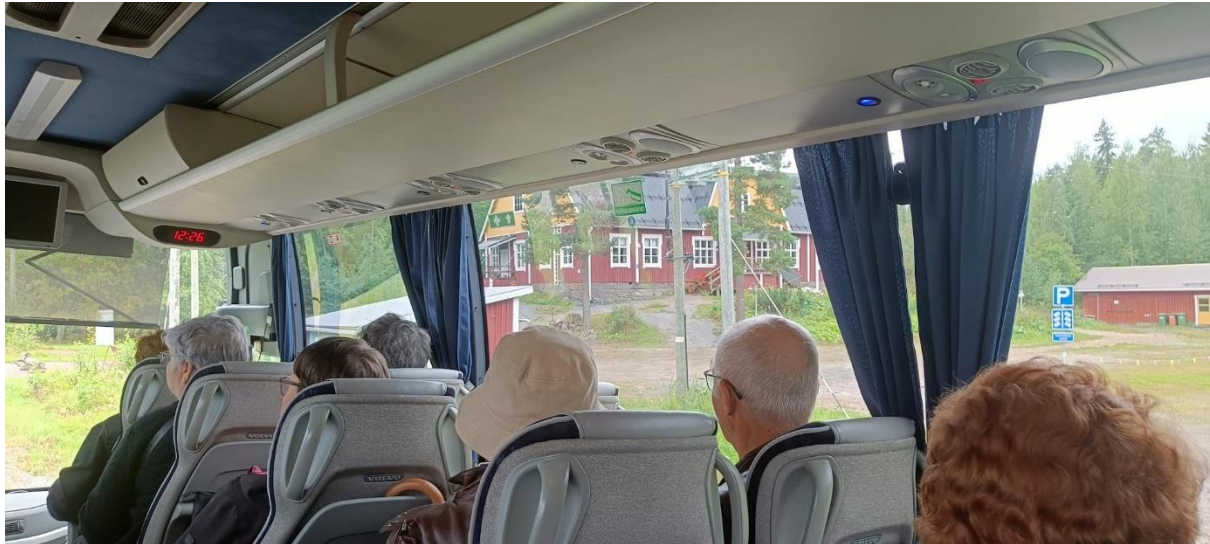
Länkipohja. Västilän Voiman Voimaintalo. Talkoilla kunnostettu.