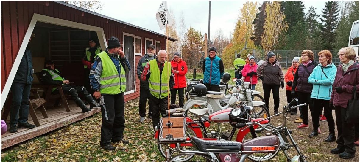
Partalan mopohöperöt ry esitteli kalustoaan ja toimintaansa