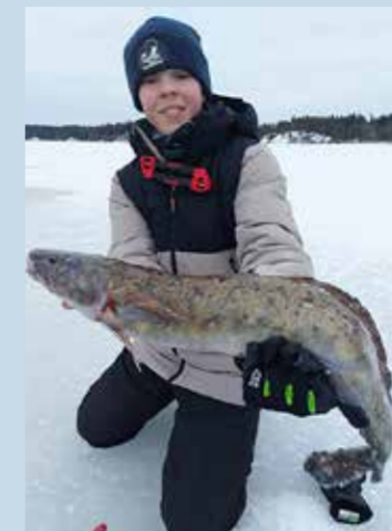
Komea made ilahdutti nuorta pilkkijää.

myös monilla paikallisyhdistyksillä pilkkikisoja pitkin talvea, käyhän tutustumassa!