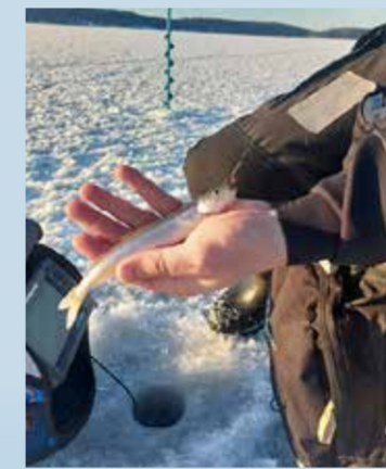
Pilkillä voi saada vaikka kuoreen, joka on mainio ruokakala.

Jos tunnistat kilpailuvietin itsessäsi, pilkkikilpailut ovat todennäköisesti juuri sinun juttusi. Lähestulkoon jokaiselta paikakunnalta löytyy talvikaan paikallisten kalastusseurojen järjestämiä pilkkikilpailuja, joten kannattaa ottaa rohkeasti yhteyttä kilpailuvastaavaan tai mennä paikalle avoimiin kilpailuihin. Kilpailujen kautta oppii ja koet mukavaa samanhenkistä yhteisöllisyyttä. Eläkkeensaajissa on