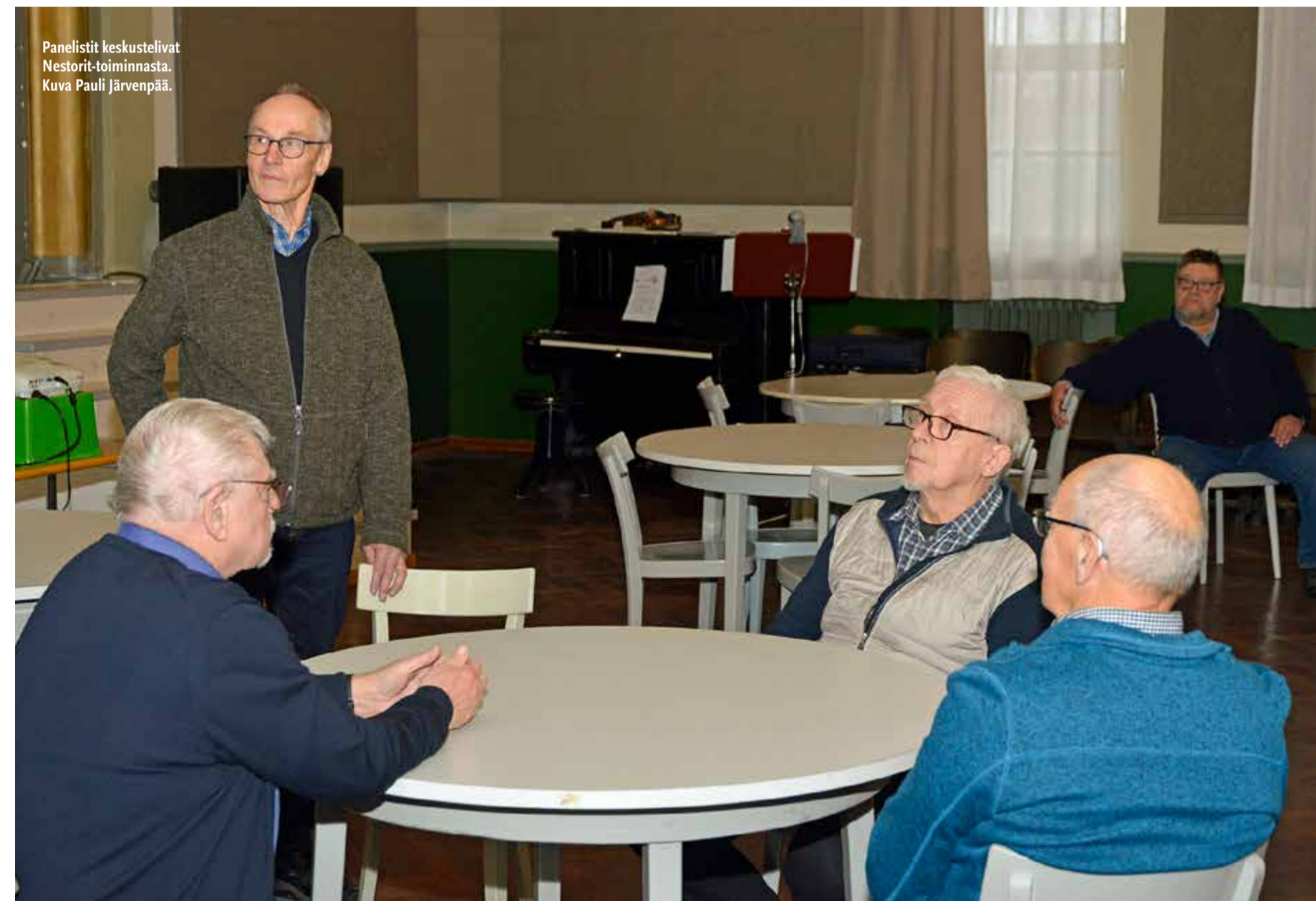
Panelistit keskustelivat Nestorit-toiminnasta.