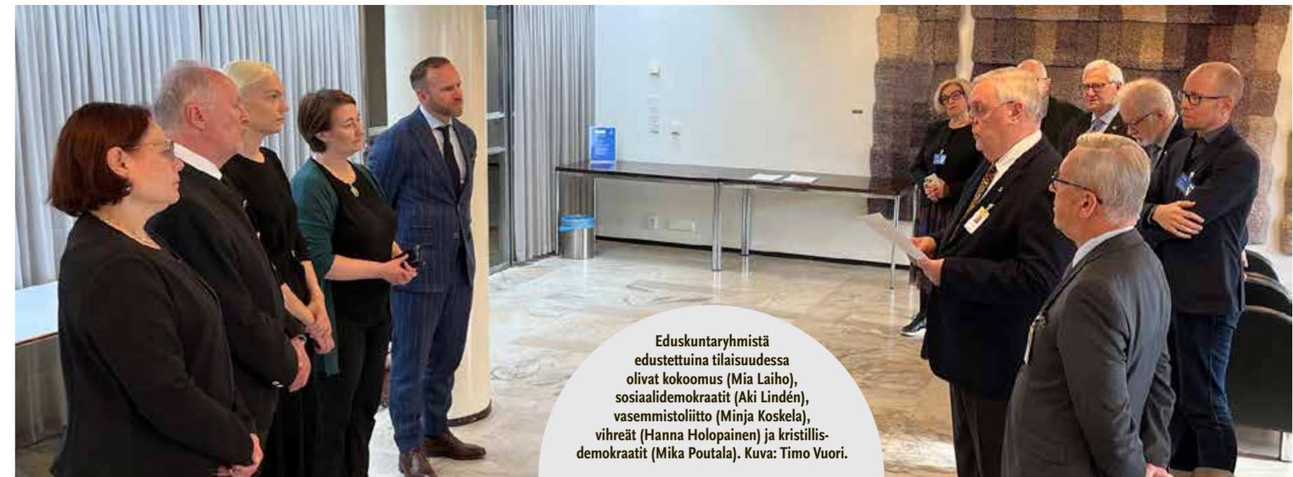
Eduskuntaryhmistä edustettuina tilaisuudessa olivat kokoomus (Mia Laiho), sosiaalidemokraatit (Aki Lindén), vasemmistoliitto (Minja Koskela), vihreät (Hanna Holopainen) ja kristillisdemokraatit (Mika Poutala).