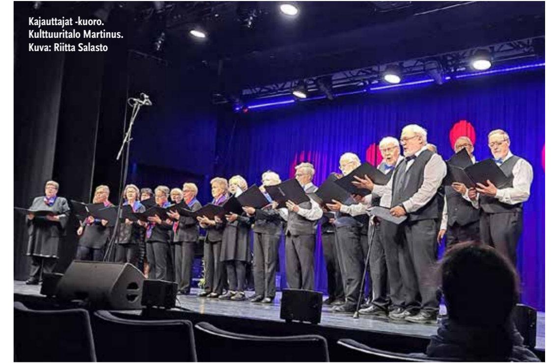
Kajauttajat -kuoro. Kulttuuritalo Martinus.

Perjantaina lokakuun 6. päivä Kulttuuritalo Martinus Vantaan Martinuslaaksossa oli täpötäynnä. Vanhustenviikon valtakunnalliseen päätapahtumaan jonoitettiin ovelta jo pari tuntia ennen esityksen alkua ja vain ennakolta ilmoittautuneet saivat mukaan. Eläkeläisjärjestöt ja kaupunkilaiset olivat olleet valppaina. Esityksen jälkeiset tarjoilut olivat maittavat. Juhlistettiin ihmisarvoa ja ikääntyneet kokivat olevansa huomion keskipisteinä.