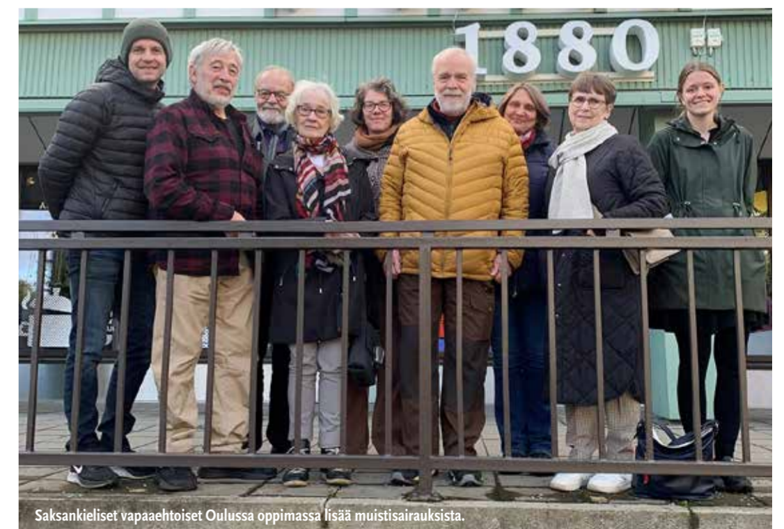
Saksankieliset vapaaehtoiset Oulussa oppimassa lisää muistisairauksista.