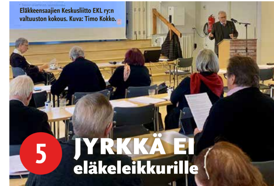
Eläkkeensaajien Keskusliitto EKL ry:n valtuuston kokous.