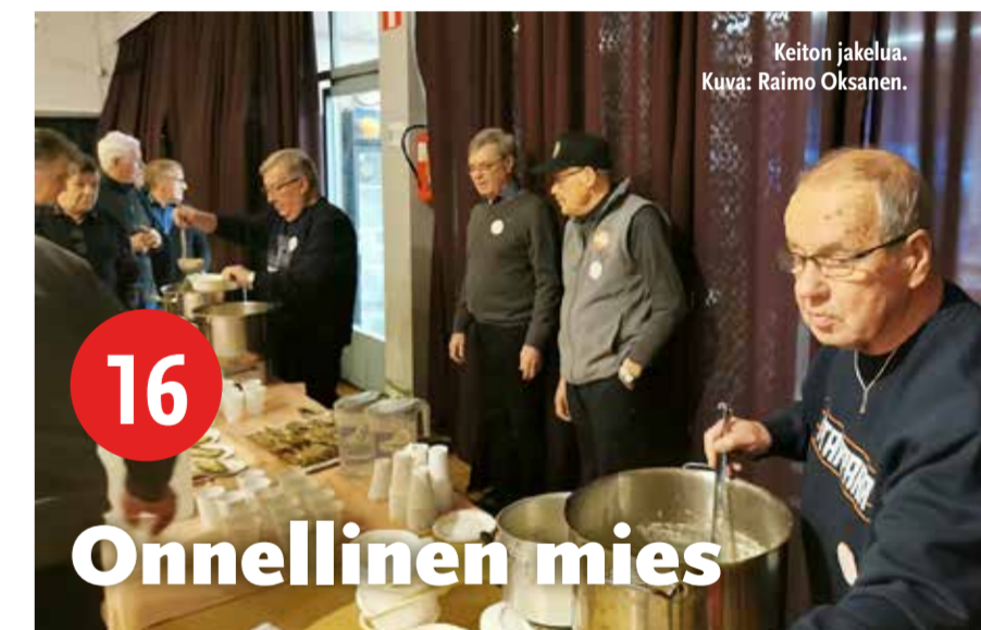
Keiton jakelua.