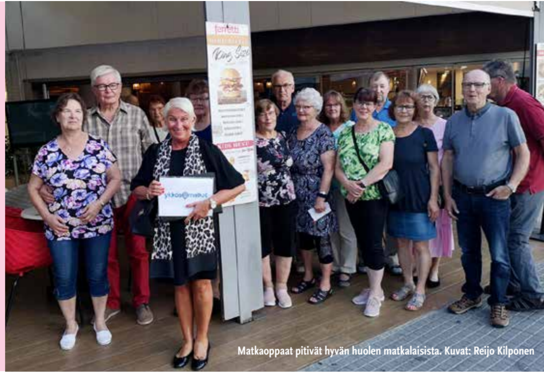
Matkaoppaat pitivät hyvän huolen matkalaisista.

Reijo Kilponen, matkavastaava, EKL:n Pohjois-Karjalan piiri