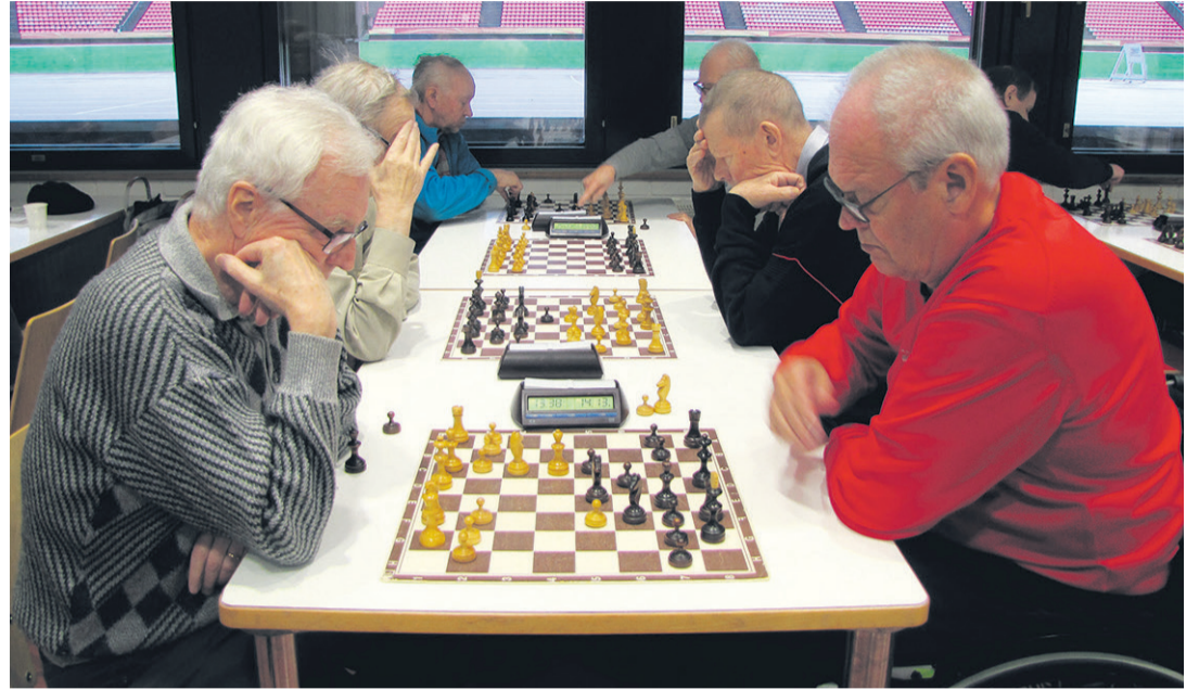
Eläkeläisten liikkuminen saattaa olla huonompaa kuin nuoruusvuosina, mutta shakissa voi silti pärjätä.

Mäkisen toimenkuvaan kuuluu myös kahvinkeitto ja pullatarjoilu. Suomalaisista shakkiturnausta olisikin