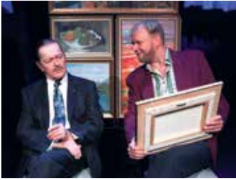
Tampereen Komediateatterissa nähdään tarina kuulusta kuvataideväärentäjästä.