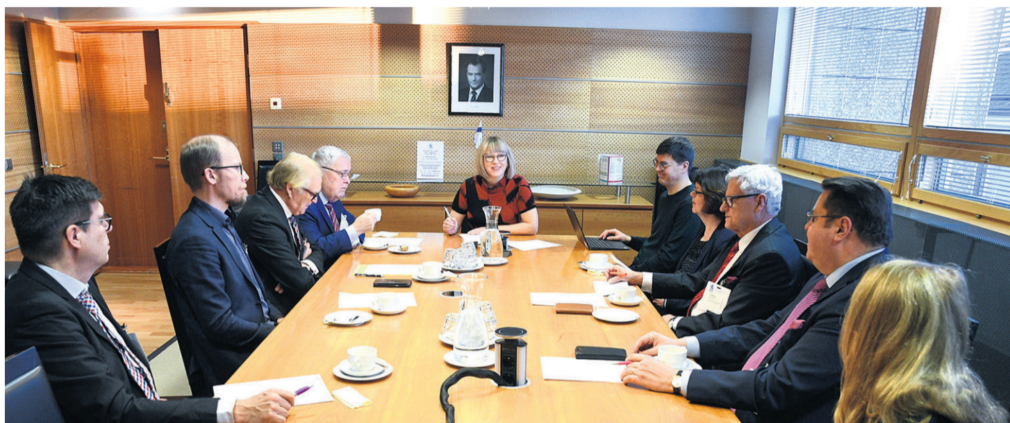
EETU-järjestöjen edustajat tapasivat pöydän päässä istuvan sosiaali- ja terveysministeri Aino-Kaisa Pekosen.

EETUn budjettitoiveissa viitataan OECD:n vertailuun, jonka mukaan asiakasmaksujen ja muun yksityisen rahoituksen osuus terveydenhuollon maksuissa on Suomessa korkeampi kuin muissa Pohjois- ja Länsi-Euroopan maissa. Asiakkailla on kolme maksukattoa, yhteensä 1 560 euroa. Nämä maksukatot tulisi EETUn mukaan yhdistää ja laskea alemmalle tasolle, esimerkiksi 1 300 euroon